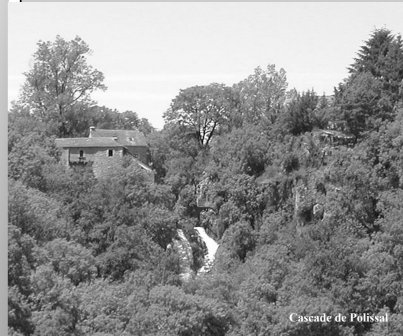
Cascade de Polissal

Bien sûr, des travaux courants de remise en état de la voirie et de certains logements ont eu lieu, mais le principal pour cette fin d'année 2002 reste la caserne des pompiers. C'est avec enthousiasme que nous voyons de jour en jour cette nouvelle bâtisse prendre forme. Cette réalisation était devenue indispensables