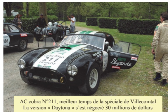
AC cobra N°211, meilleur temps de la spéciale de Villecomtal La version « Daytona » s'est négocié 30 millions de dollars

Cette manifestation internationale exceptionnelle (il n'en existe que deux) et prestigieuse, emprunte les routes secondaires qui font le charme de nos départements en alliant découverte touristique et épreuve sportive. Seule restriction à la participation à cette épreuve : inscrire un véhicule qui a couru le tour de France automobile entre 1951 et 1973 ! Deux types de course : vitesse ou régularité. Des noms connus étaient au volant des voitures de collection : Panis, Bresseur, Holtz, Lafitte, etc... Mais les