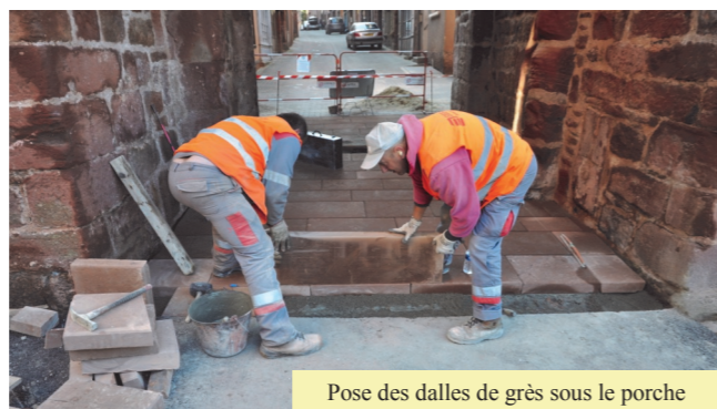
Pose des dalles de grès sous le porche

Les travaux de la place de la mairie sont achevés. À l'heure à laquelle nous écrivons ces lignes, nous pouvons raisonnablement penser