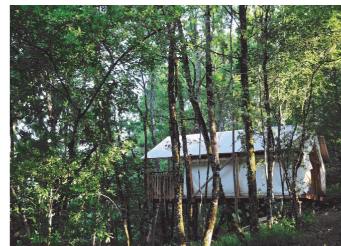
Situés sur un terrain boisé, escarpé, dominant le village et la vallée du Dourdou, les hébergements proposés sont atypiques

Les travaux ont subi beaucoup de retard en raison des intempéries exceptionnelles de ce printemps bien pluvieux. Heureusement, grâce à l'aide amicale et enthousiaste de nombreux bénévoles de Villecomtal et d'ailleurs, l'achèvement est proche, pour une ouverture prévue deuxième semaine de juillet. Lile Delmas remercie vivement tous ceux qui ont consacré leur temps et leur peine à ce résultat heureux.