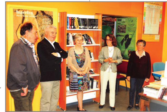
L'inauguration a eu lieu le samedi 29 juin

Pendant l'été (juillet août), la médiathèque est ouverte le mercredi de 10h à 12h, le reste de l'année : le mardi de 14h à 16h et le samedi de 10h à 11h30.