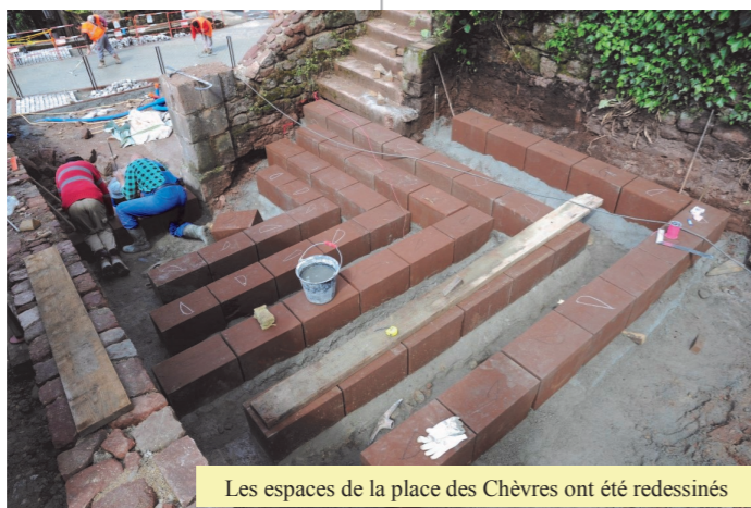
Les espaces de la place des Chèvres ont été redessinés

Quoi qu'il en soit, les aménagements réalisés et ceux à venir permettront à Villecomtal de ne plus être une cité que l'on traverse, mais un lieu où l'on s'arrête, ou on peut se promener en toute sécurité afin d'apprécier pleinement les qualités architecturales et paysagères du site et, où il fait bon vivre.