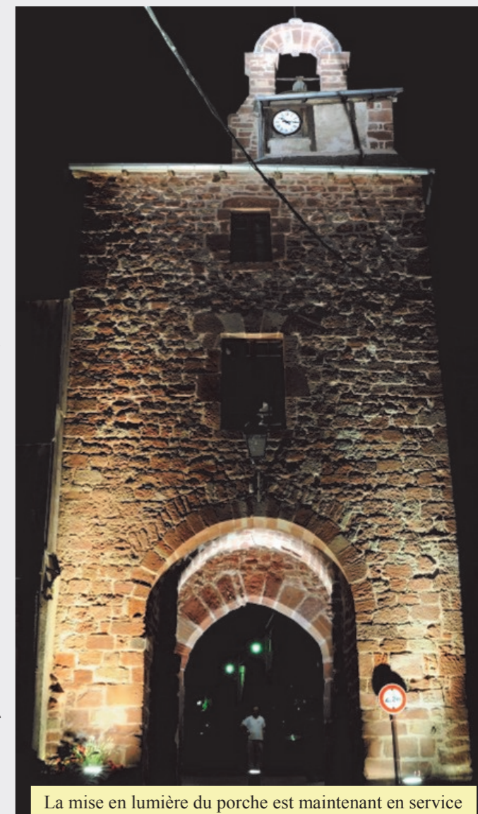
La mise en lumière du porche est maintenant en service

sionnels, ils ont vécu ces mois de travaux avec sérénité, mal-