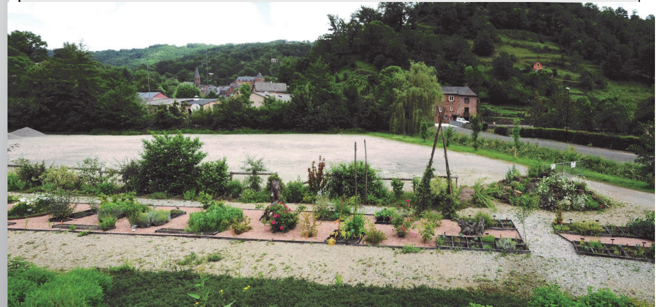
La mobilisations de fidèles bénévoles assure l'entretien et l'évolutions de la promenade Vinh Luu

Pour modifier le zonage d'assainissement et procéder à l'aliénation de chemins ruraux, nous aurons besoin de lancer deux enquêtes publiques dans le courant de l'été, la population sera largement informée en temps voulu.