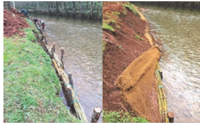
pendant le chantier de fascinage de la berge

Lot Dourdou, a été réalisé sur une quarantaine de mètres en rive droite du Dourdou, en amont du bloc sanitaire de l'ancien camping. Cette technique végétale permet, en disposant des fagots tressés en pied de berge et en bouturant le talus reconstitué, d'éviter l'érosion des bords de rivière. Ce chantier collaboratif auquel ont participé nos employés communaux, le technicien du SIAH du Dourdou mais aussi l'équipe de la cellule opérationnelle rivière de Rodez Agglomération est une réussite. Ce dispositif a très bien résisté aux crues de fin mai.