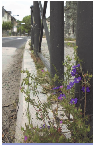
Miroir de Vénus en bord de route

La loi l'impose désormais, les collectivités ne pourront plus utiliser de produits chimiques pour désherber les espaces publics, autres que ceux autorisés en agriculture biologique. Les objectifs sont à la fois de ne plus exposer directement la population et les agents techniques à ces produits, mais également de lutter contre les pollutions liées à ces usages. Sur notre commune, les herbicides étaient utilisés principalement pour entretenir les allées du cimetière, et certaines zones de voiries. Ce changement de pratique sera bénéfique pour l'amélioration de notre cadre de vie, mais ne doit pas impliquer de surcoût notable pour la commune. C'est pourquoi, nous avons décidé de solliciter le Syndicat mixte Lot Dourdou, qui mène actuellement une opération mutualisée pour faire réaliser un plan de désherbage des espaces publics sur une vingtaine de collectivités en Aveyron et en