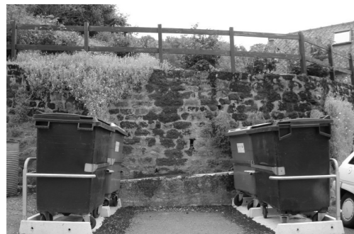
Le bon réflexe : container jaune ou container noir ?

Nous sommes redevables à la communauté de communes de Marcillac du remboursement des frais portant sur les services suivants : collecte classique des ordures ménagères, collecte sélective depuis janvier 2002, collecte des cartons, transport vers le centre d'enfouissement et le centre de tri et traitement de l'ensemble de ces ordures.