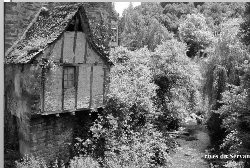
rives du Servant

Vous remerciant de votre soutien et de l'intérêt que vous portez à votre commune, je vous souhaite une bonne saison estivale.