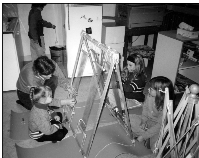
Le stage de tissage de la Toussaint

- le centre de loisirs « Le Château des Enfants » est ouvert pour les enfants de 3-12 ans les mercredis tous les 15 jours et les vacances scolaires. Pour l'année scolaire 2004-2005 nous continuons à proposer des activités centrées sur le thème « découvre ton village » comme par exemple en novembre la visite du château de la Servayrie et en décembre la visite de la bergerie LAURENS aux Espeyroux au moment de la naissance des agneaux.