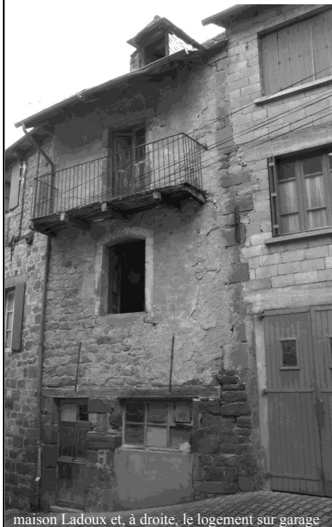
maison Ladoux et, à droite, le logement sur garage

La mairie met à la vente un ensemble immobilier composé d'une petite maison dite « maison Ladoux » rue Droite, mitoyenne du château et d'un logement attenant dont l'accès se situe rue Haute. Un garage pouvant recevoir 2 véhicules fait également partie du lot. Toute personne intéressée est priée de se faire connaître en mairie avant la fin du mois d'août.