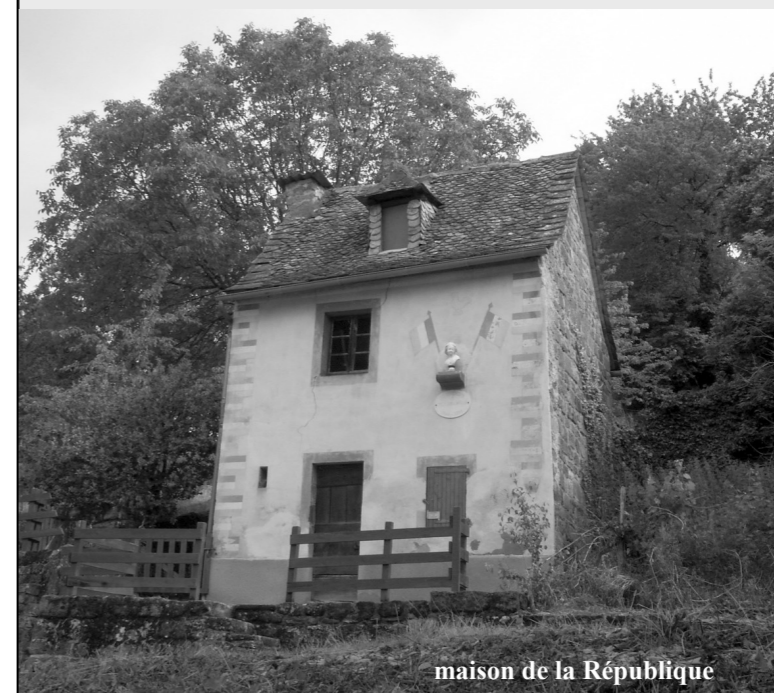
maison de la République

Soyez en tous remerciés, des présidents des associations aux chevilles ouvrières. Vous contribuez tous, à votre façon, à la réputation de