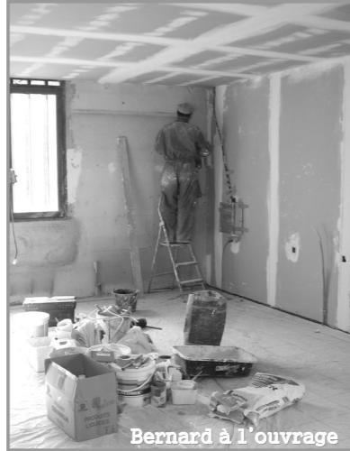
Bernard à l'ouvrage

Depuis l'automne dernier, le pont sur le Dourdou desservant la nouvelle zone d'activité est terminé. Cette construction, réalisée par l'entreprise Lagarrigue de Firmi, a permis l'accès aux engins de travaux publics pour effectuer les travaux de voirie, réseaux et terrassements nécessaires pour la mise en place des plates-formes de construction. L'ensemble des lots proposés sont déjà retenus ou en voie de l'être très prochainement. Des aides conséquentes de l'Europe et du Conseil Général viendront minimiser le prix d'achat pour les artisans.