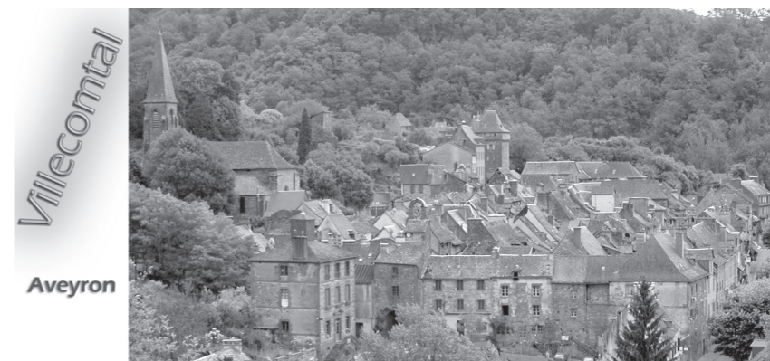
village médiéval dans le Rougier

0565446021 - commune.villecomtal@wanadoo.fr