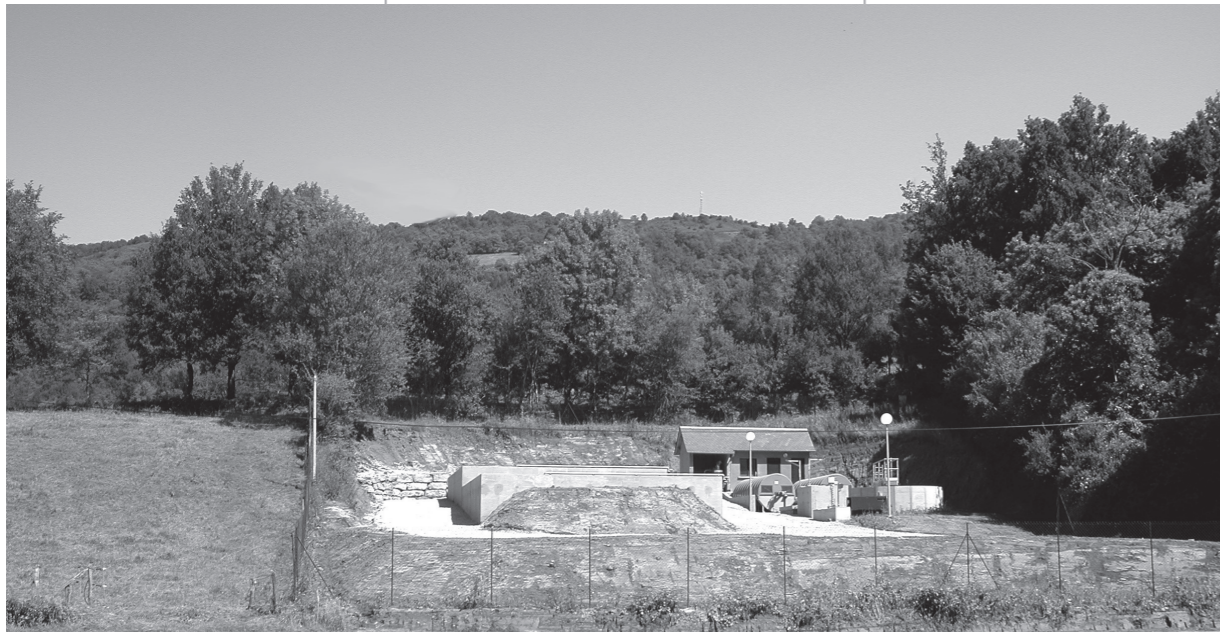
Un effort tout particulier a été apporté à l'intégration paysagère de la station de traitement au bord de la RD 22

Il est à noter que le SIAEP a profité de ces travaux pour mettre à niveau son réseau d'eau