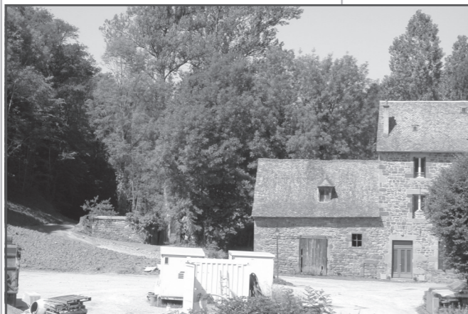
L'accès à la station de refoulement de Bouillet (à gauche de la photo, au fond, dans l'ombre). Positionnée au bord du Dourdou, au point de plus bas du bourg, elle est chargée de collecter par gravité naturelle la totalité des effluents et de les acheminer vers la station de traitement.

Entre temps, les enrochements, la récupération des eaux pluviales, le bitumage et l'engazonnement seront effectués. Après un mois de fonctionnement, le procès