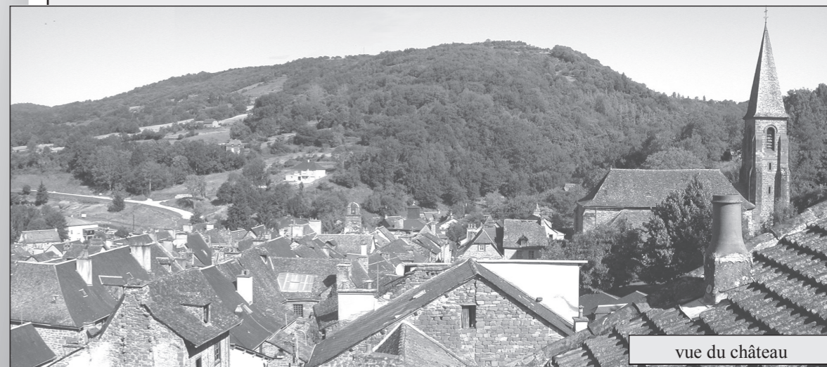
vue du château

avec toutes les nuisances que cela comporte. Je suis reconnaissant de la compréhension dont tous les habitants du bourg ont fait preuve. Depuis de longs mois ils subissent ces désagréments avec calme.