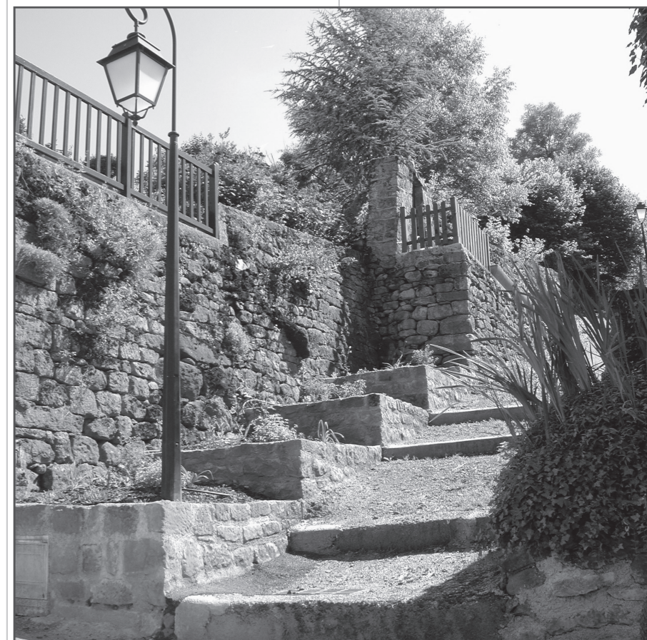
« Le Poujoulas » ou « La Grimpette », joli sentier en direction du lotissement du Clos. Depuis le cœur du village, il vous invite à une promenade balisée vers le château du Puech, sous Limon et retour au dessus de l'église.

La municipalité se félicite du dévouement des bénévoles ("Popo", Josette, Marinette et Jean-Claude aidés par Didier) et les remercie pour le remarquable travail accompli. Les riverains sont