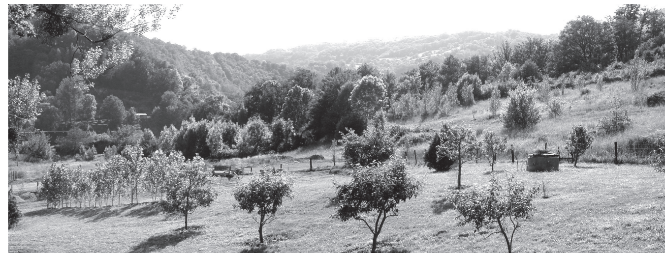
Le futur emplacement du lotissement « La Blanzague » vu du lotissement du « Haut du Clos »