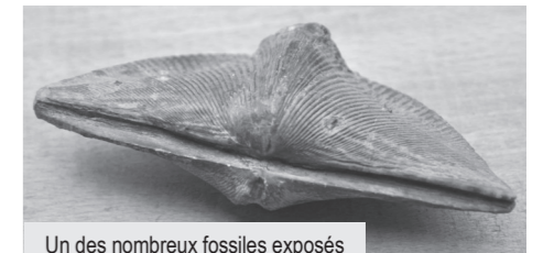
Un des nombreux fossiles exposés