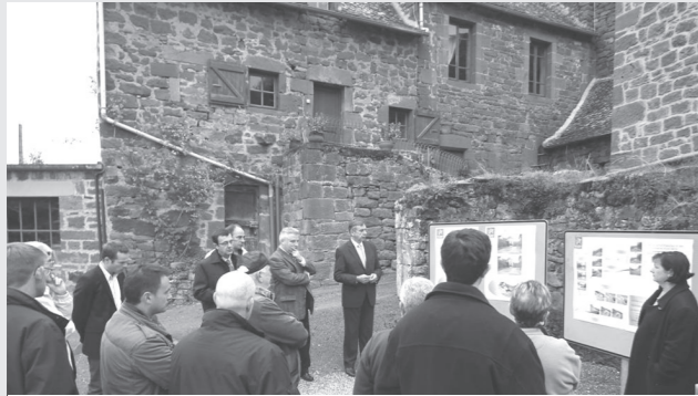
Inauguration de la traversée de Saulodes

Le début de journée a été l'occasion d'inaugurer les travaux de la RD 904 et surtout de remercier les habitants du hameau de Saulode pour la patience dont il ont su faire preuve durant toute la durée du chantier et la