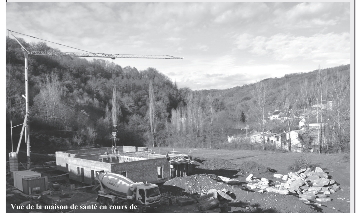
Vue de la maison de santé en cours de

Mais laissons là nos soucis pour vivre une fin d'année harmonieuse, heureuse et que vos souhaits les plus chers se réalisent.