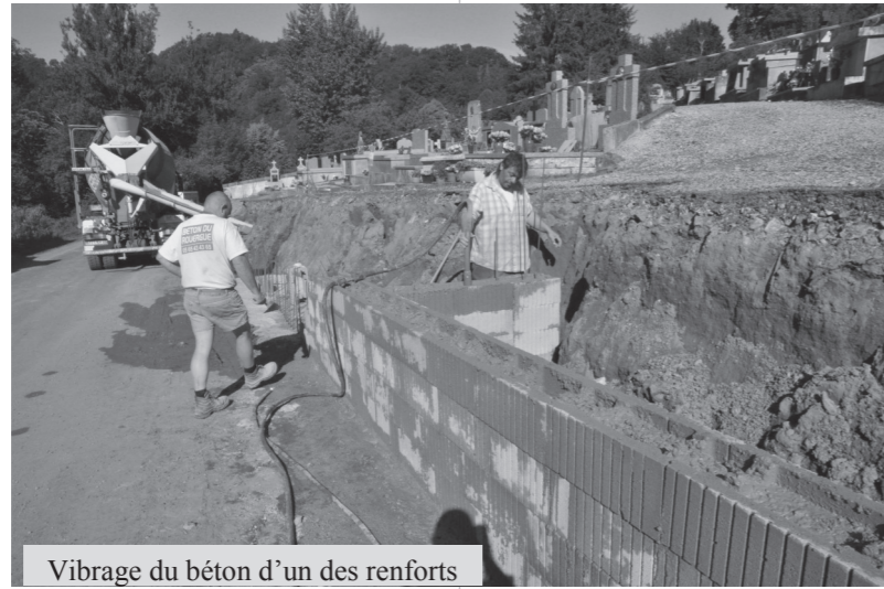
Vibrage du béton d'un des renforts

Il y a déjà 4 ans que le mur du cimetière perpendiculaire à la RD 22 a été restauré par l'entreprise Lacombe. Un affaissement important de l'autre mur, le long de la RD, est