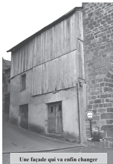
Une façade qui va enfin changer

permettra de recevoir, sur deux étages, l'accueil touristique en rez-de-chaussée, la collection Charles Roy et l'espace des Enfarinés dans lequel on pourra découvrir ou se remémorer ce fait d'histoire cocasse où Villecomtal fut un haut lieu d'activité. Des réflexions de préparation sont en cours avec le Pays du Haut Rouergue. Conformément à sa compétence « tourisme », la communauté de commune d'Estaing prend naturellement en charge les travaux nécessaires qui devraient être engagés courant 2012.