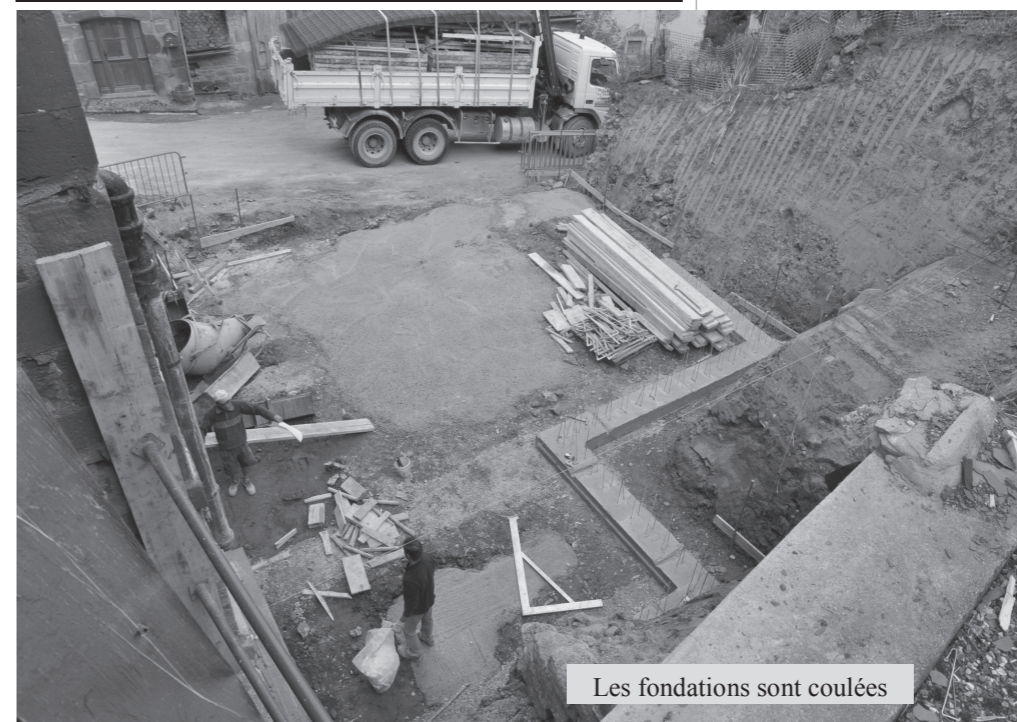
Les fondations sont coulées

Le montant total de l'opération s'élève à 324.743€ HT, honoraires compris. Les aides devraient avoisiner les 50% de ce montant.