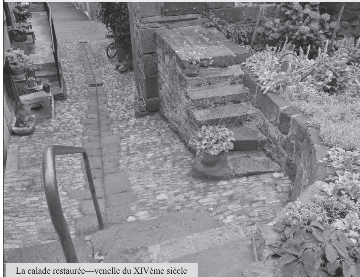
La calade restaurée—venelle du XIV e siècle

Remercions encore une fois ceux qui ont permis l'élaboration de ce