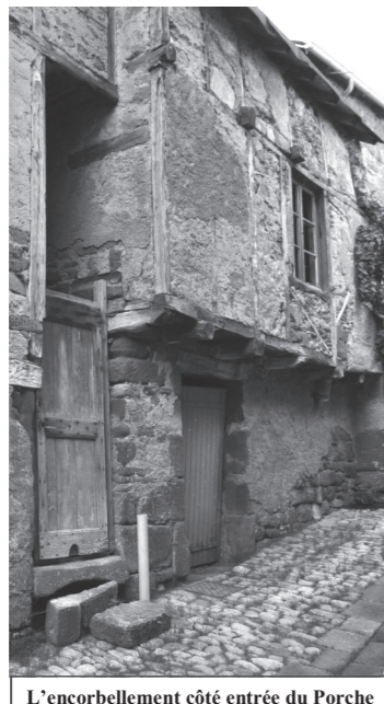
L'encorbellement côté entrée du Porche

permettra de recevoir, sur deux étages, l'accueil touristique en rez-de-chaussée, la collection Charles Roy et l'espace des Enfarinés dans lequel on pourra découvrir ou se remémorer ce fait d'histoire cocasse où Villecomtal fut un haut lieu d'activité. Des réflexions de préparation sont en cours avec le Pays du Haut Rouergue. Conformément à sa compétence « tourisme », la communauté de commune d'Estaing prend naturellement en charge les travaux nécessaires qui devraient être engagés courant 2012.