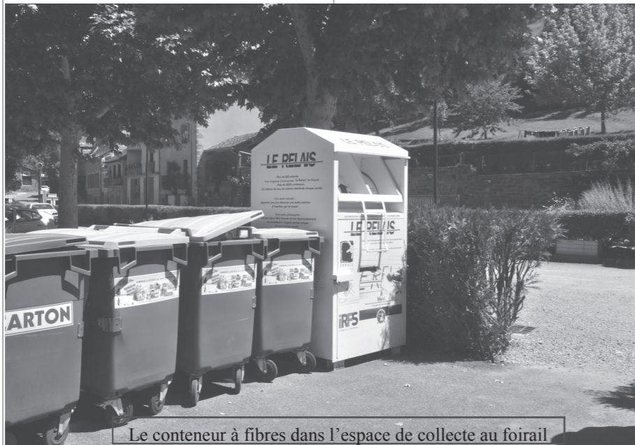
Le conteneur à fibres dans l'espace de collecte au foirail

aujourd'hui, 25% du verre se retrouve dans les sacs noirs, ce qui coûte de 80 à 130€ la tonne. Ce même verre déposé dans une colonne une fois recyclé rapporte 22€ la tonne.