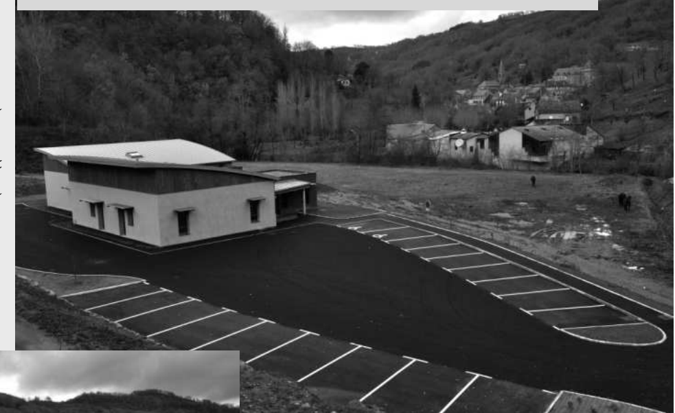
La maison de santé est prête pour fonctionner début janvier 2012

Comme vous le découvrirez dans ce bulletin, cette année 2012 sera aussi celle de la nouvelle mairie et de la « renaissance » de la maison Bazet. Avec la 1ère tranche de l'o-