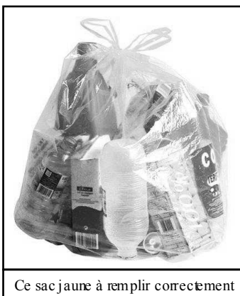
Ce sac jaune à remplir correctement

Afin de vous accompagner et faciliter le transport de vos emballages en verre vers l'une des colonnes de collecte, la cté de cnes de Marcillac a le plaisir de vous offrir un sac de pré-collecte pouvant contenir jusqu'à 9 bouteilles. Ces sacs sont disponibles à la mairie de Villecomtal.