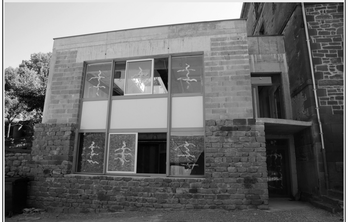
Façade de la nouvelle mairie qui sera complétée d'un crépis faisant le lien avec l'ancien bâtiment

Ce bulletin vous présente aussi l'avancé des différents projets communaux : extension nouvelle mairie, opération « cœur de village », modernisation, entretien et mise aux