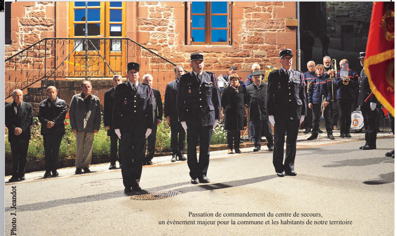
Passation de commandement du centre de secours, un événement majeur pour la commune et les habitants de notre territoire

l'ouverture de l'Espace Des Enfari-nés, l'extension du lotissement : La Blanzague 2, les travaux de la salle des Associations et d'autres évènements que je vous laisse découvrir dans ce bulletin.